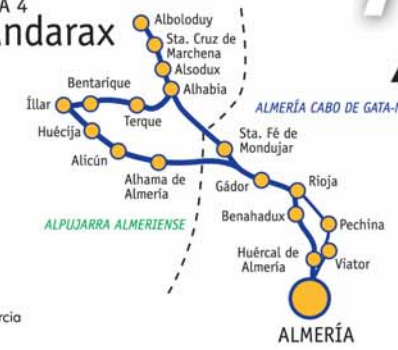
RUTA 7 Entre el Mar y las Sierras