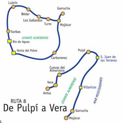
RUTA 8 De Pulpí a Vera